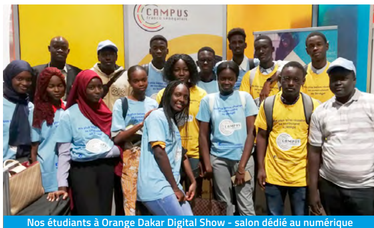
Nos étudiants à Orange Dakar Digital Show - salon dédié au numérique

La formation se tiendra dans les locaux de Supdeco Dakar et au sein de l'Edulab IMT à Dakar : nouvel espace de travail moderne et modulable, favorisant le travail individuel ou en petits groupes et équipé de matériel informatique et pédagogique innovant.